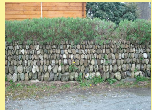
Clawdd with fairly typical vertically set stone in courses

This leaflet has been funded by the Gareth Pritchard Memorial Fund, commemorating the late Aberconwy Master Craftsman, dedicated waller and Branch Officer.